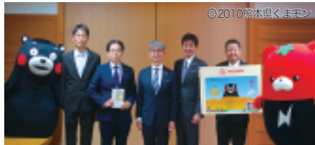
熊本県庁での寄付贈呈式（令和7年11月19日）