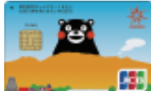
「くまモン」デザイン日専連JCBカード