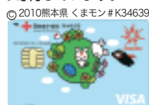
赤十字応援カード