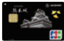
熊本城応援カード