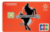
ロアッソ熊本カード